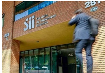
Avanza proyecto anti-evasión que obligará a bancos a informar al SII los saldos superiores a 1.500 UF