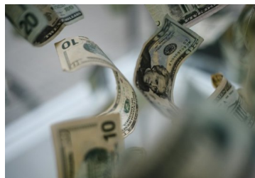
El dólar en Chile se dispara y llega a su máximo valor del año tras subir $ 30 en la semana